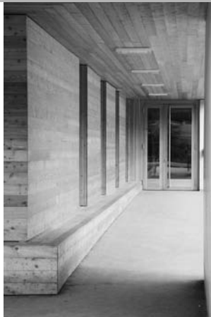
Schulanlage Feld Jenaz

Machbarkeitsstudie Holz Zentrum Graubünden Holz präsentiert die Produkte und Dienstleistungen seiner Mitglieder im Internet und in einem neuen Bulletin. Unsere Kunden sollen aber auch die Möglichkeit haben, die Holzkette real zu erleben und zu spüren. Aufgrund dieser Überlegungen hat eine Projektgruppe, bestehend aus Vertretern unserer Teilverbände und ergänzt durch einen Mitarbeiter des Kantonalen Hochbauamts Graubünden, im Januar das Projekt «Holz Zentrum» in Angriff genommen. Geprüft wird die Erstellung eines modernen Holzbaus.